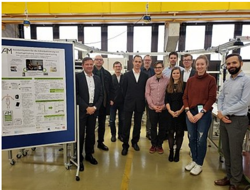
Bild oben: Das Projektteam von PALM4.Q im Trainingscenter der Leopold Kostal GmbH & Co. KG in Lüdenscheid

Bild unten: Das Projektteam von AIM bei der Abschlussveranstaltung an der TU Dortmund